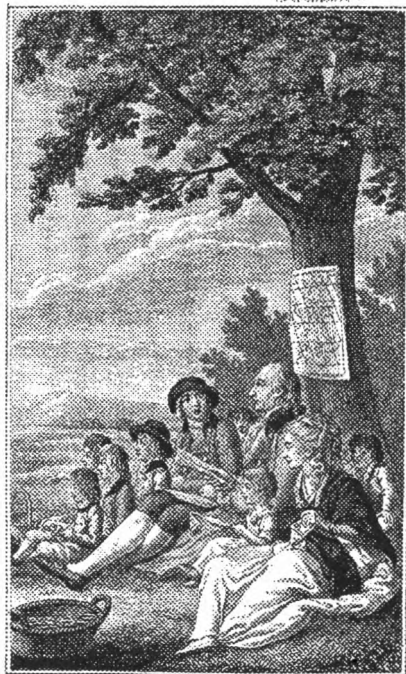
Рис. 3. Идеальная семья как образовательный институт. На рисунке изображен Кампе, который рассказывает историю о Робинзоне Крузо. [Даниэль Ходовецкий. Иллюстрация на фронтисписе книги Иоахима Генриха Кампе «Детский Робинзон», том 1. Брауншвайг, 1807]