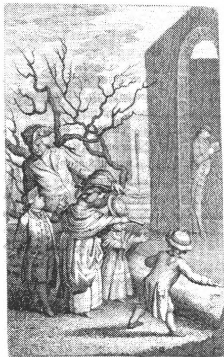
Рис. 4. Дети из образованных семей среднего класса получали представление о природе во время прогулок с родителями и учителями, руководимые и сопровождаемые ими [(Christian Felix Weisse, Der Kinderfreund: Ein Wochenblatt , XCIII. Stück bey 12 April 1777, Leipzig: Siegfried Lebrecht Crusius, 1777, иллюстрация при странице 21). Воспроизводится с разрешения Котценовской детской библиотеки]